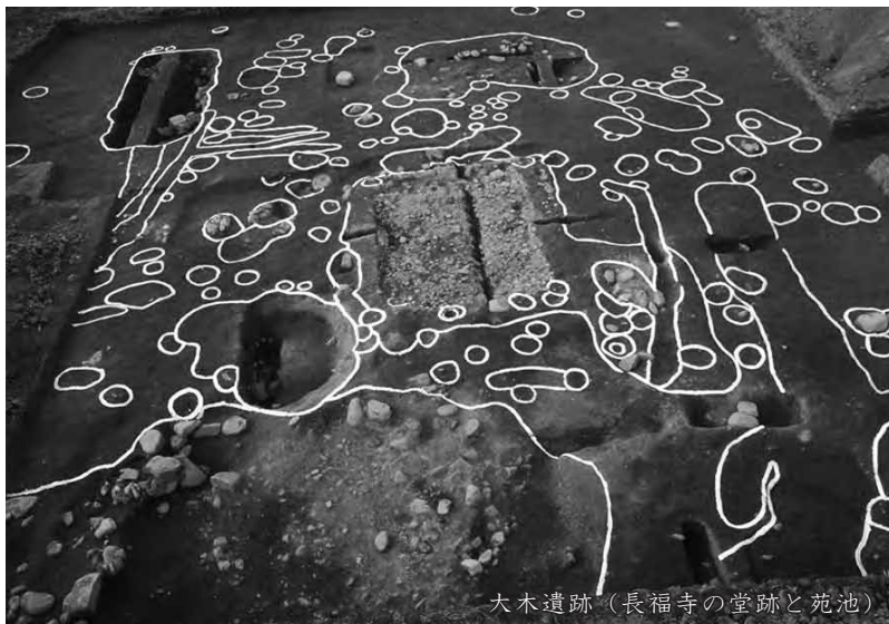
大木遺跡（長福寺の堂跡と苑池）