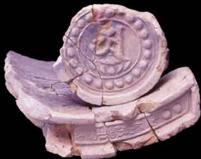
「檀波羅密寺」文字瓦と梵字瓦（湯浅跡）