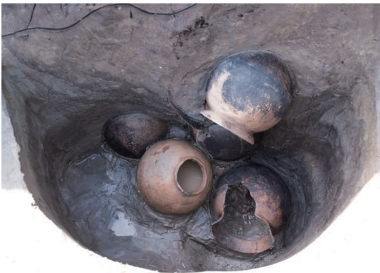
写真3. 古墳時代初頭の遺物出土状況 (埋戻して見学できませんが、出土遺物を公開します)