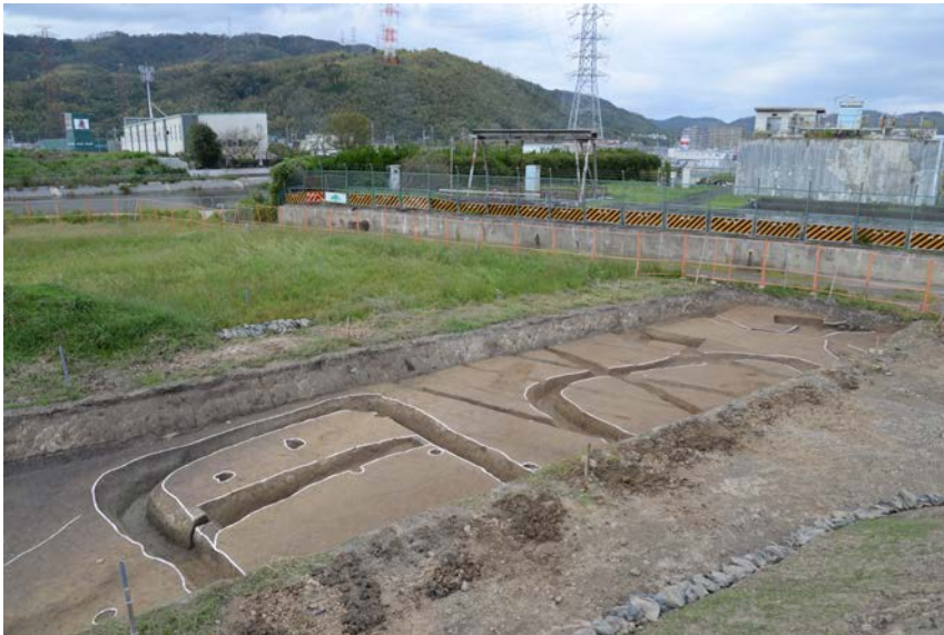
写真2. 古墳時代前期の周溝墓群