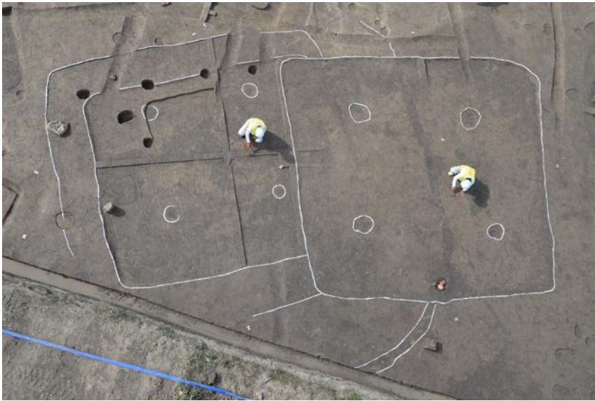
写真1. 古墳時代前期の竪穴建物