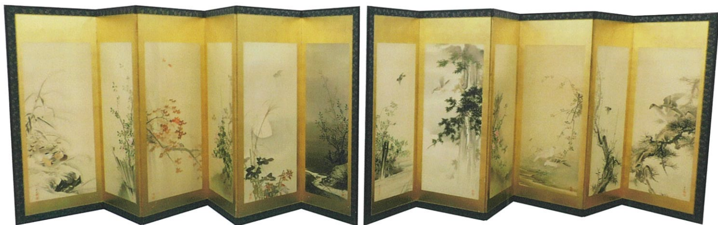
(呑洲・花鳥図 (六曲一双))