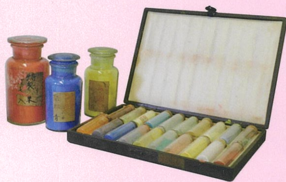
(小川翠村・スケッチ、顔料)

開館時間 午前9時～午後5時 (入館は午後4時30分まで) 休館日 4月20・27・29日 5月4・5・6・7・11・18・25日 6月1・8・15・22日