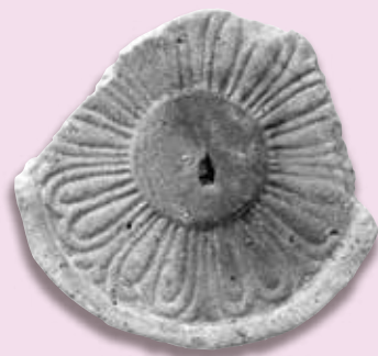
軒丸瓦(禪興寺跡) [泉佐野市教育委員会蔵]