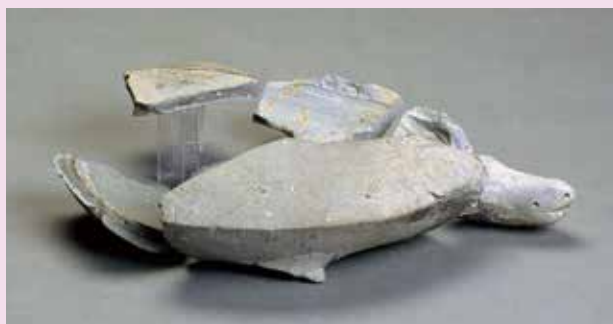
亀形須恵器(諸日遺跡) [泉佐野市教育委員会蔵]