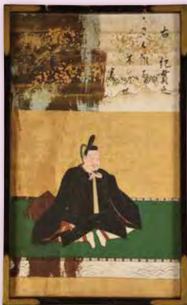
蟻通神社本三十六歌仙図絵馬(紀貫之) [蟻通神社蔵] 泉佐野市指定文化財

13世紀に入り、当時長滝庄を経営していた九条家は家領「日根荘」設立の許可を得、日根野荒野の開発に乗り出します。また、長滝庄の庄官を務めた中原氏はのちに日根野氏と名乗り土着化していくことから、長滝庄は市域の歴史に大きくかかわっていくことになるのです。