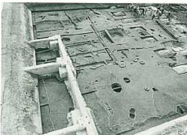
弥生時代後期・古墳時代前期・鎌倉時代の遺構面（東半分）

周辺は条里地割が良好に遺存する地域であり、中世以降は水田として利用されていたものと考えられる。この条里