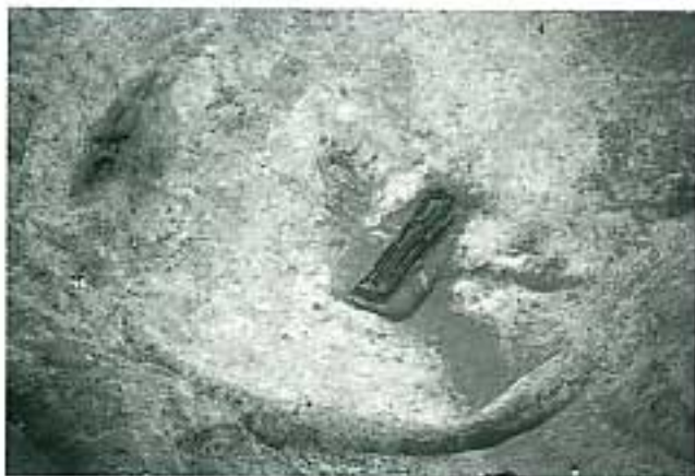
6号墳主体部検出状況（北より）

久宝寺遺跡は八尾市の北東部を中心に、大阪市・八尾市に広がる南北約1.6km、東西約1.7kmの範囲の縄紋時代から近世に至る複合遺跡である。今年度の調査は、JR大和路線久宝寺駅の西側において、寝屋川流域下水道竜草水環境保全センター水処理施設等の建設に伴い、西と東をそれぞれ（その1）・（その2）と称して発掘調査を行っている。その結果、調査区の南西部で古墳時代初頭の方形周溝墓4基、古