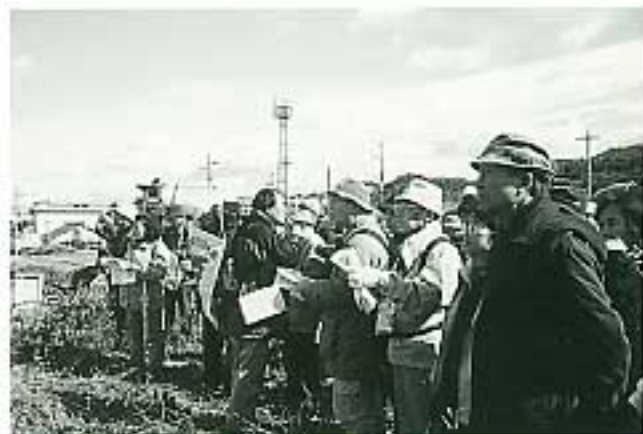
第10回例会 西小山古墳墳頂にて

今年度も大阪府内の一般には余り知られていないが、発掘調査された遺跡を中心に廻り、足元に埋もれたままになっている歴史を再認識しました。