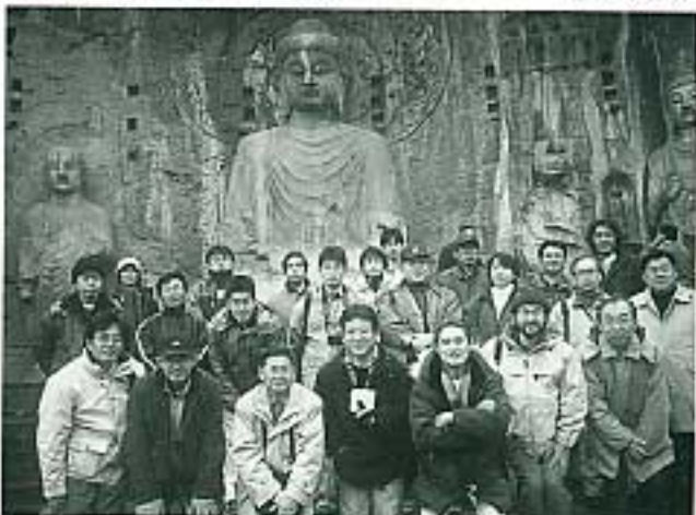
世界遺産 竜門石窟にて