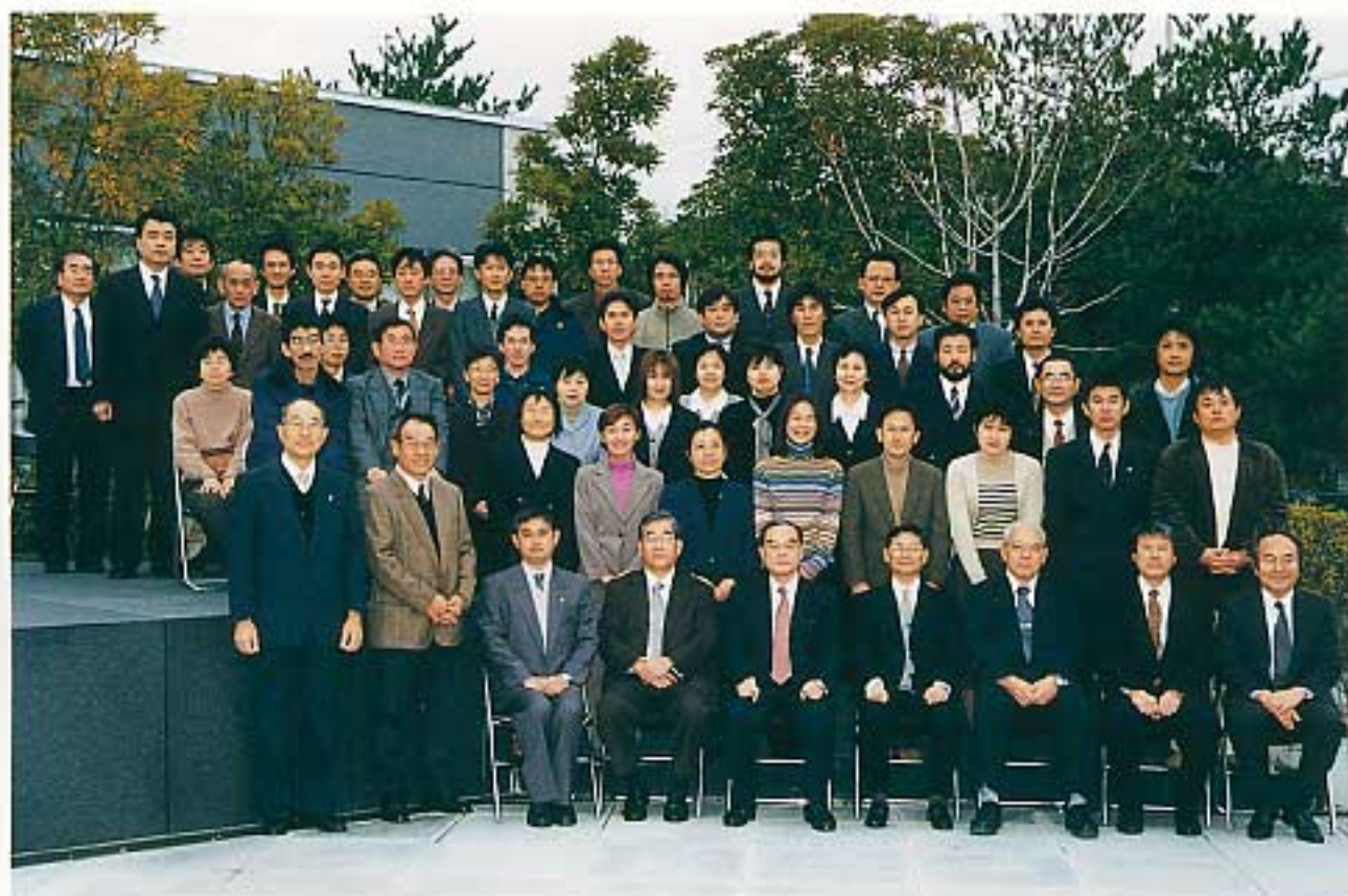
2002年1月4日 初顔合わせ (本部事務所にて)