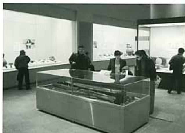
展示会場風景