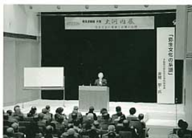
ご講演中の金関先生